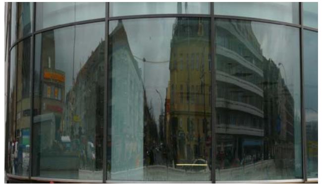
Gläserner Hafenpavillon mit Gastronomie und Aussichtsterrasse als Entree

Tempelhof-Schönebergs Bezirksbürgermeister Ekkehard Band freute sich mit Kollegen aus dem Bezirksamt beim Richtfest über die Revitalisierung des Tempelhofer Damms durch dieses Projekt.