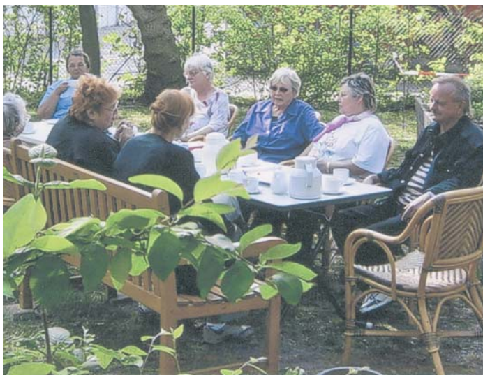
Miteinander wohnen und miteinander reden

Weit mehr als 90 Prozent der über 65-Jährigen unseres Bezirks leben zurzeit in einer eigenen Wohnung. In der Mehrzahl wünschen sie sich bis an ihr Lebensende in gewohnter Umgebung zu bleiben. Das aber ist auch eine Herausforderung für die Vermieter, dafür Sorge zu tragen, dass pünktlich zahlende Mieter auch angemessenen Wohnraum, barrierefrei und leicht erreichbar, bezahlbar und gut betreut und beraten, behalten können. Für alle aber, die wissen wollen, was möglich ist, um ein Älterwerden in Würde und Ruhe zu genießen, gibt es umfangreiche Beratungen. Übrigens nicht nur für Alte. Zahlreiche Vereine und soziale Zentren bieten sachliche und freund-