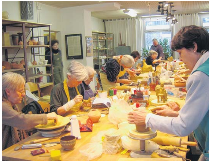
Aktiv am Leben teilhaben – wie hier im Keramikatelier – ist für Senioren heute selbstverständlicher denn je.

Zu diesem Zwecke gibt es in Lichtenberg unter anderen Angeboten auch 34 Heime und Einrichtungen, deren Selbstverpflichtung es ist, Seniorinnen und Senioren gut zu betreuen. Die Seniorenvertretung hat eine Arbeitsgruppe einberufen, die mit den Leitungen und den Fürsprechern der Bewohner über die bestehenden Probleme berät. Es ist uns eine wichtige Verpflichtung, gerade für die Menschen da zu sein.